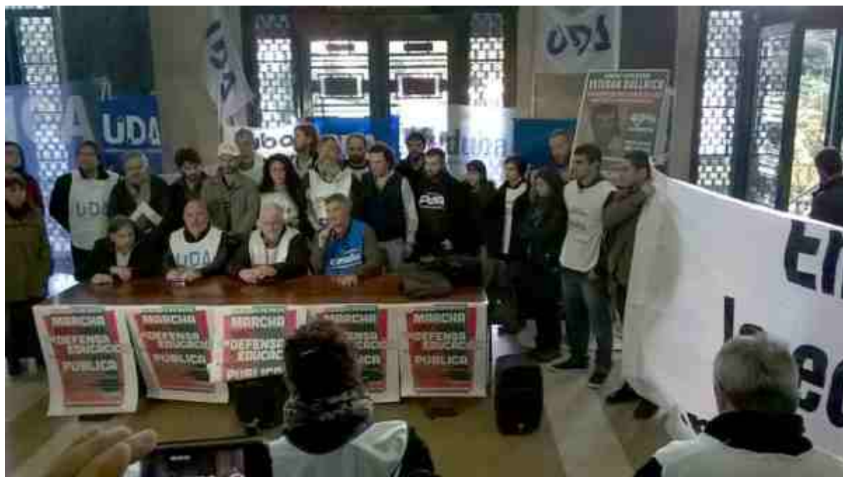
Conferencia de prensa conjunta de los organizadores de la Marcha en Defensa de la Educación Pública. Hall Facultad de Medicina UBA - Mayo 2016

anuncio, seguido del trabajo y ratificación por las Asociaciones de Base y el Plenario de Secretarios Generales de CONADU, llegamos a organizar la primera Conferencia de Prensa Conjunta convocada por CONADU y Conadu Histórica (ver foto). La misma fue realizada en una carpa, también conjunta, montada frente al Ministerio de Educación y continuó por la tarde con una radio abierta, de la que participaron numerosos representantes docentes de ambas federaciones, como así también representantes estudiantiles. Conadu Histórica realizó en el lugar su Plenario de Secretarios Generales. Por la tarde, CONADU realizó una movilización de más de mil compañeros que llegaron marchando al Ministerio de Educación. Esta acción fue muy útil para comenzar a medir nuestra capacidad de convocatoria, de organización y de puesta a punto de una acción en la calle que sumó experiencia luego de las marchas del 24 de febrero y del 24 de marzo, realizadas contra los despidos, y para conmemorar el día de la Memoria a los 40 años del golpe de Estado, respectivamente.